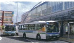
昭和バスのつば (伊都キャンパス行) (徒歩1分)