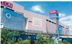
イオンモール福岡伊都 (徒歩2分)