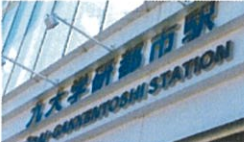
JR九大学研都市駅 (徒歩1分)