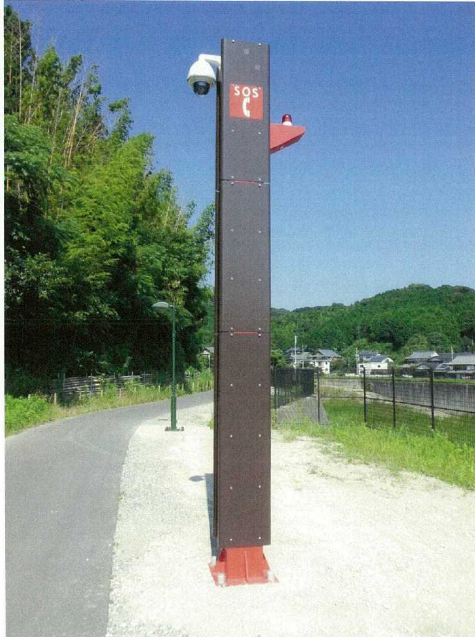
【Emergency call unit general view】