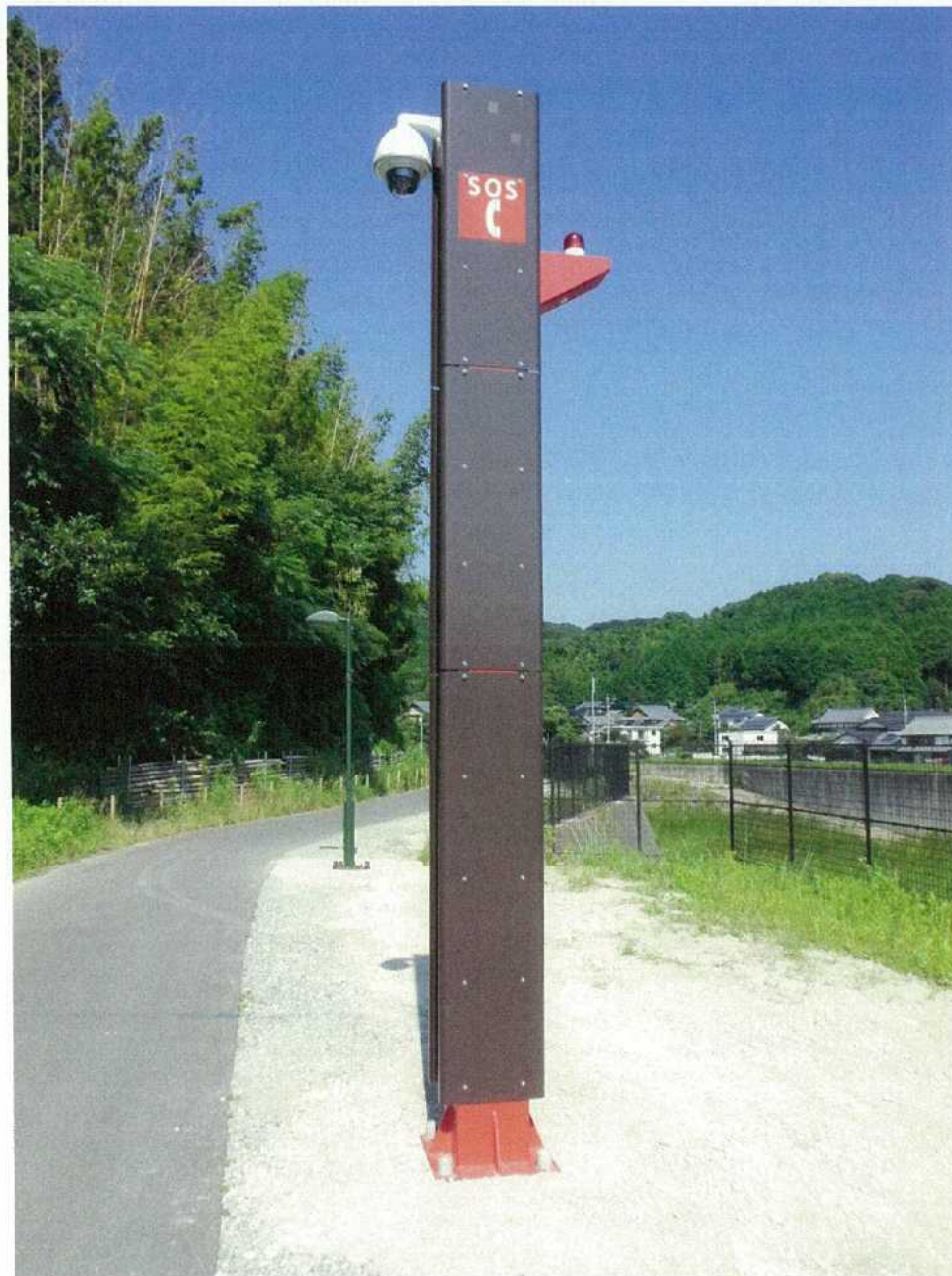
【緊急通報装置全体図】