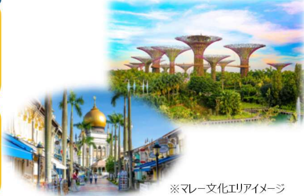
※マレー文化エリアイメージ