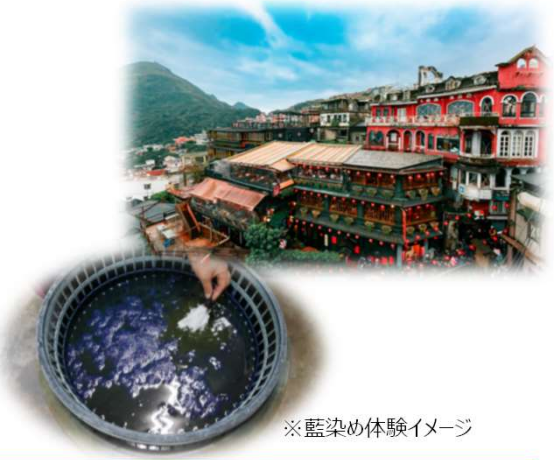
※藍染め体験イメージ

・九份地区 茶芸体験 ・三峡地区 藍染体験 ・国立故宮博物院見学 現地の歴史施設や伝統文化体験を通じ、異文化理解を深めます。